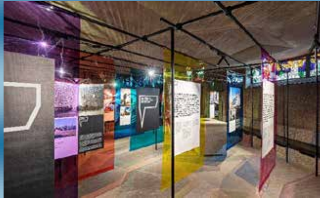
Teil der Ausstellung in St. Gertrud, Köln

Dreifaltigkeitskirche, Stolbergstraße 54