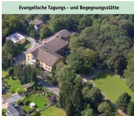
Evangelische Tagungs- und Begegnungsstätte

Haus am Turm, Am Turm 7, 45239 Essen Tel. 0201.40 40 67, www.hausamturm.de