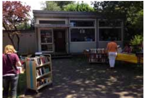
Die Gemeindebücherei beim Sommerfest