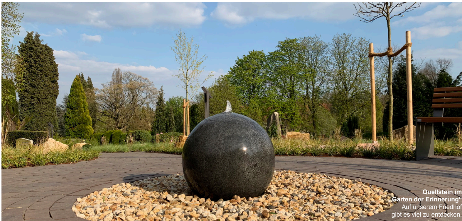
Quellstein im „Garten der Erinnerung“ Auf unserem Friedhof gibt es viel zu entdecken.